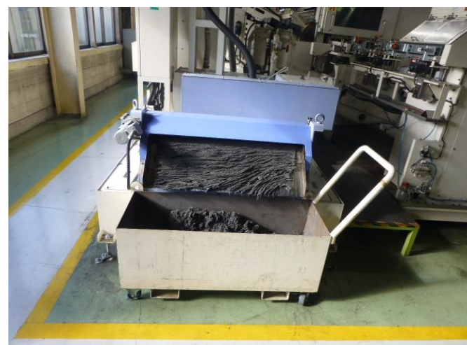
回収スラッジドライ形状